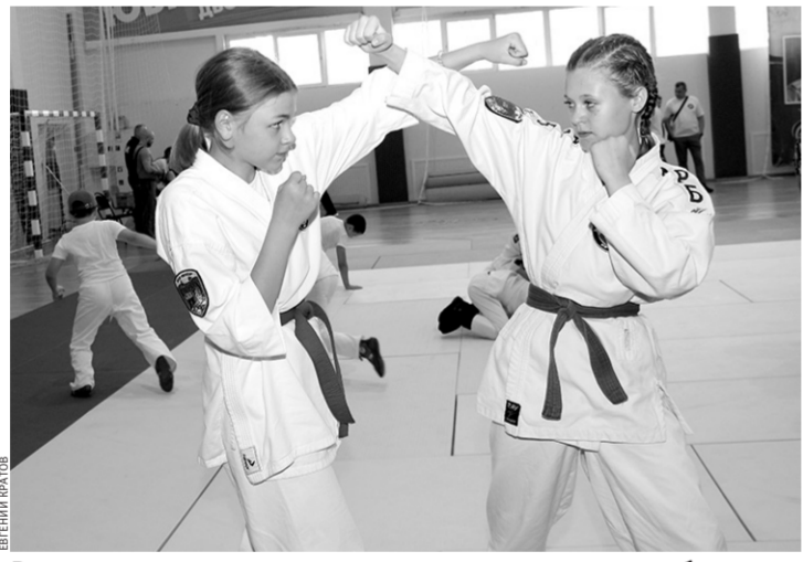
В соревнованиях приняли участие и представительницы слабого пола

— Желаю всем крепкого здоровья, успехов и чтобы ни одно поколение больше не видело тех ужасных военных лет, которые пережили наши предки. Я бы хотел, чтобы вы росли на примере наших героев, которые повторяют подвиг наших дедов