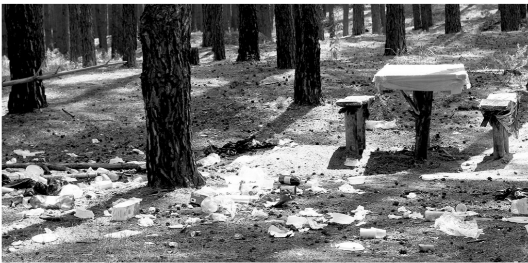
Такие поляны оставляют после себя горе-туристы