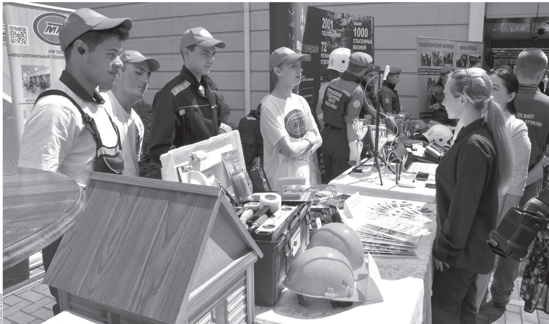
В Многопрофильном технологическом колледже можно получить множество профессий, в том числе и спасателя

Следует отметить, что для работы с посетителями на ярмарке трудоустройства были представлены отдельные зоны: площадка профориентации, карьерного консультирования, консультации психолога, площадка для организации консультаций гражданам с ограниченными возможностями здоровья, лекционная площадка для старшеклассников с элементами интерактивной демонстрации рекламных роликов образова-