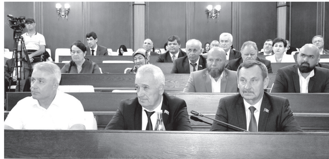
На последней сессии депутаты рассмотрели 17 вопросов

В работе последнего в VI созыве пленарного заседания принял участие Глава Карачаево-Черкесии Рашид Темрезов